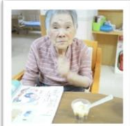
Dユニット 9/16(月)プリン を食べました